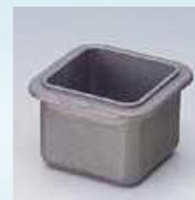
Speciális forrasztó üst