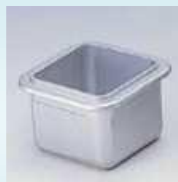
Hagyományos forrasztó üst