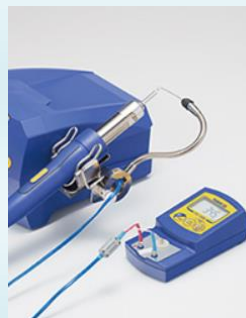
C1541 meleglevegős állomással