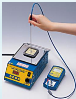
A1310 forrasztó üsttel